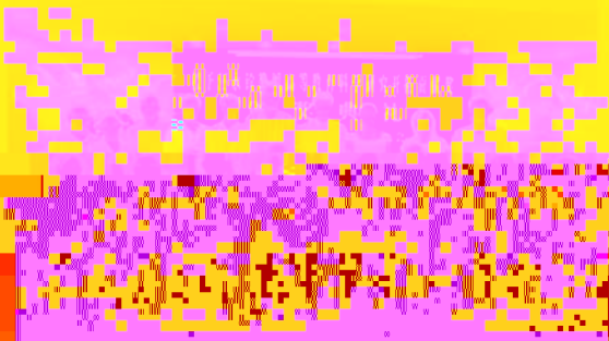
教育學院2011級研究生開學典禮全體合影

他期望同學們可以自信滿懷地去實現心中崇高的理想，期望同學們要具有面對權威的勇氣，超越權威的決心，并預祝大家在教育學院的學習生涯取得圓滿成功！